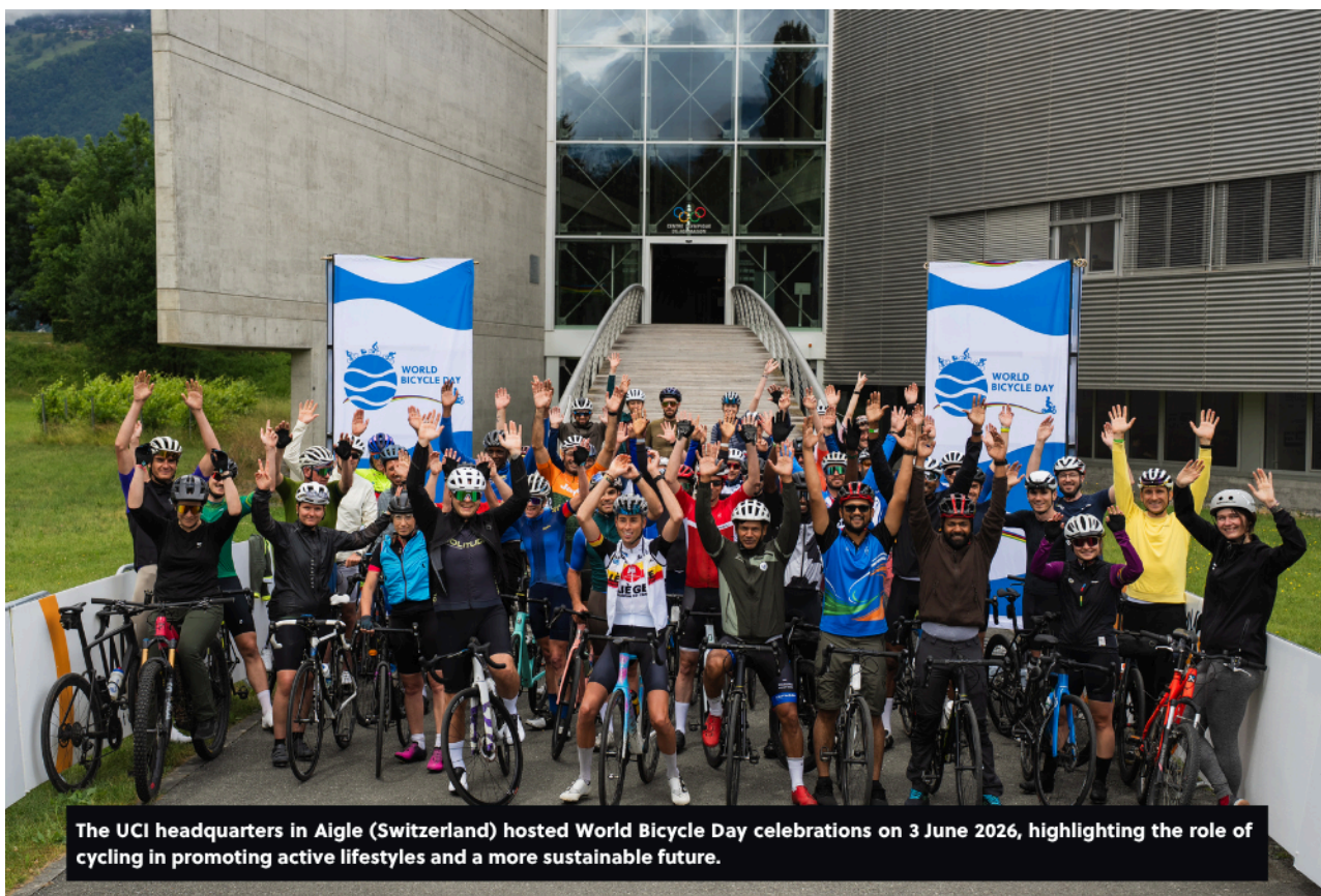
The UCI headquarters in Aigle (Switzerland) hosted World Bicycle Day celebrations on 3 June 2026, highlighting the role of cycling in promoting active lifestyles and a more sustainable future.